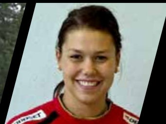
Filippa Idéhn Handboll